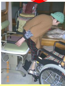
玄関の上りかまちを昇降いすで上り車いすへ移動中