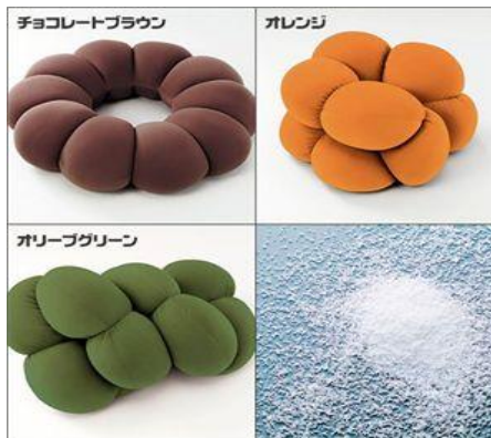
チョコレートブラウン

リラックス・ドーナツ・クッション ¥1,428 (税込み) 色: イエロー・ピンク・ブルー